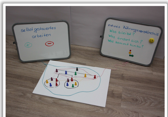
Führungskultur weiterentwickeln – Komplexität in unsicheren Zeiten meistern

Erfolgreiche Führung heißt eine gute Balance zu finden die die Wirtschaftlichkeit ebenso wie die Bedürfnisse der Kunden und Mitarbeiter berücksichtigt.